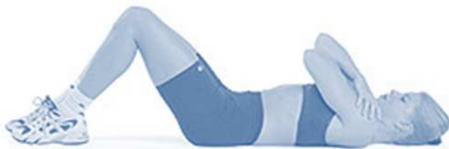
Figura 02: Posição inicial do candidato no teste de abdominal com flexão completa do tronco.