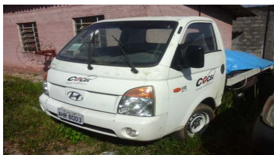
LOTE 10 -HYUNDAI ANO 2009/10 - PLACA AHR 8003 - Valor mínimo R$ 10.000,00