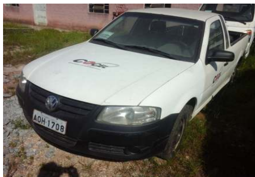
LOTE 02 – SAVEIRO ANO 2006/07 - PLACA AOH 1708 - Valor mínimo R$ 9.000,00