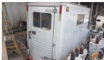
LOTE 21 – 1 UNID. HABITÁCULO - Valor mínimo R$ 1.500,00