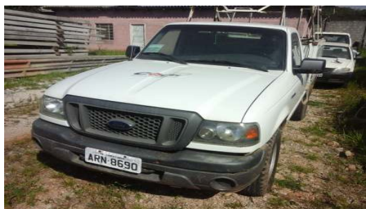
LOTE 09 – RANGER ANO 2009 - PLACA ARN 8690 - Valor mínimo R$ 25.000,00