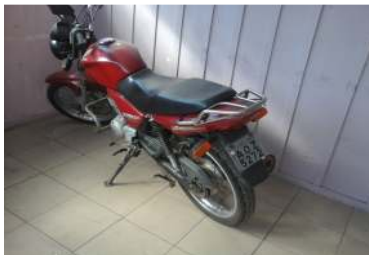
LOTE 18 – MOTO HONDA CG 150 - PLACA AOZ 5272 - Valor mínimo R$ 1.500,00