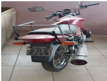
LOTE 17 – MOTO HONDA CG 150 - PLACA AOZ 5268 - Valor mínimo R$ 1.500,00