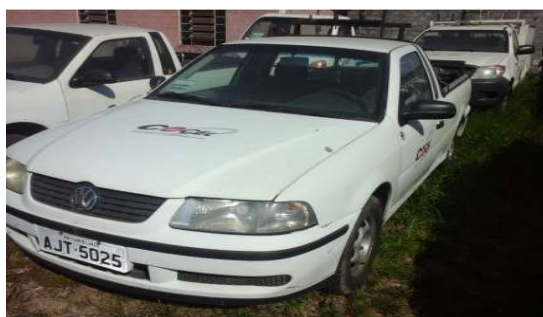
LOTE 06 – SAVEIRO ANO 2001 - PLACA AJT 5025 - Valor mínimo R$ 7.000,00