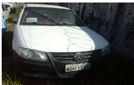
LOTE 01 – GOL ANO 2006/07 - PLACA AOH 1730 - Valor mínimo R$ 5.000,00