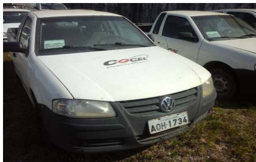
LOTE 03 – SAVEIRO ANO 2006/07 - PLACA AOH 1734 - Valor mínimo R$ 9.000,00