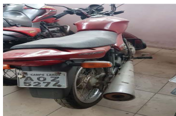
LOTE 19 – MOTO HONDA CG 150 - PLACA AOZ 5274 - Valor mínimo R$ 1.500,00