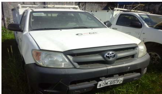
LOTE 07 – HILUX ANO 2007 -PLACA AOM 8572 - Valor mínimo R$ 25.000,00