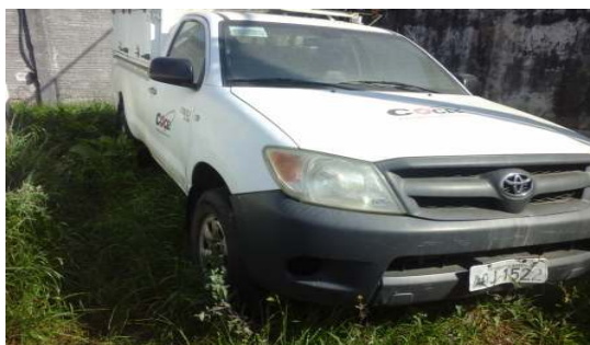
LOTE 08 – HILUX ANO 2006/07 - PLACA AOJ 1522 - Valor mínimo R$ 25.000,00