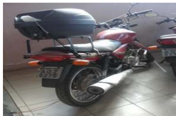
LOTE 20 – MOTO HONDA CG 150 - PLACA AOZ 5275 - Valor mínimo R$ 1.500,00