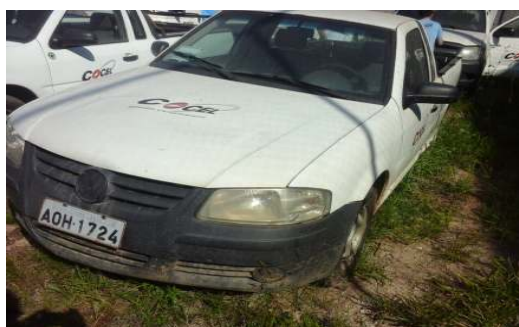
LOTE 04 – SAVEIRO ANO 2006/07 - PLACA AOH 1724 - Valor mínimo R$ 9.000,00